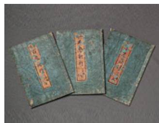
鳥石石燕『画図百鬼夜行』 水木しげる所蔵